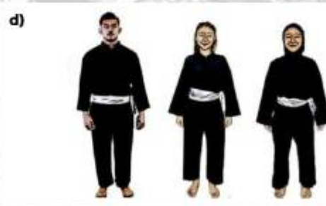
d) ATLET SENI BEREGU