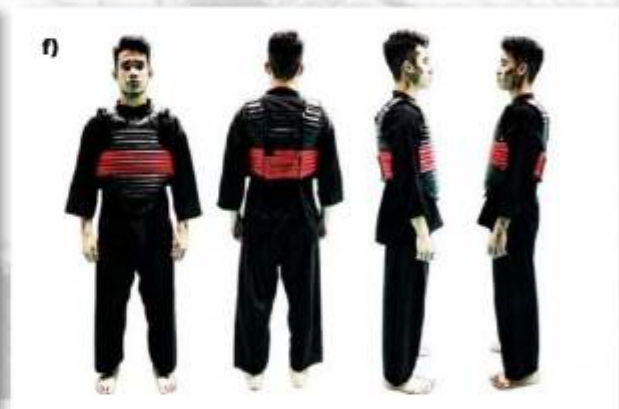
f) ATLET TANDING SUDUT MERAH