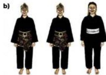
b) ATLET TGR PUTRI