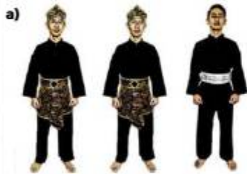
a) ATLET TGR PUTRA