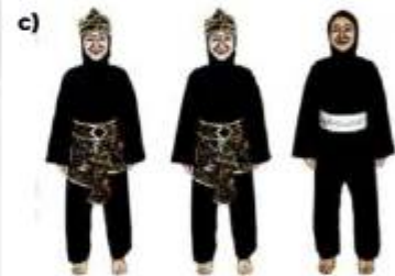
c) ATLET TGR PUTRI BERHIJAB