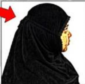
ATLET PUTRI BERHIJAB