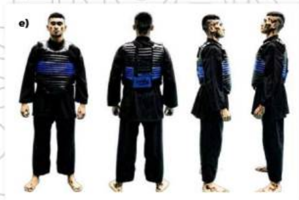
e) ATLET TANDING SUDUT BIRU